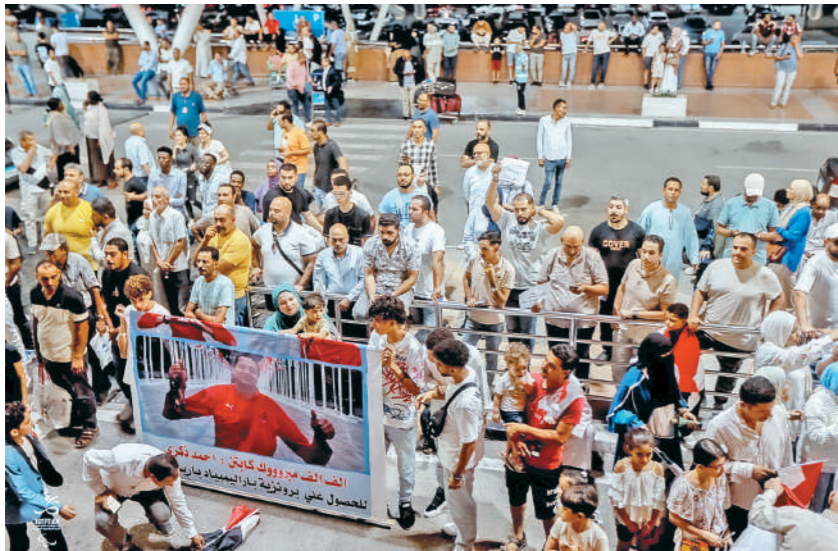
الأهالي في استقبال أبطال مصر البارالمبيين في مطار القاهرة بعد العودة من باريس

حافلتان مكشوفتان وزغاريد ومزمار بلدي احتفاء بالأبطال.. وإطلاق أسمائهم على مراكز الشباب