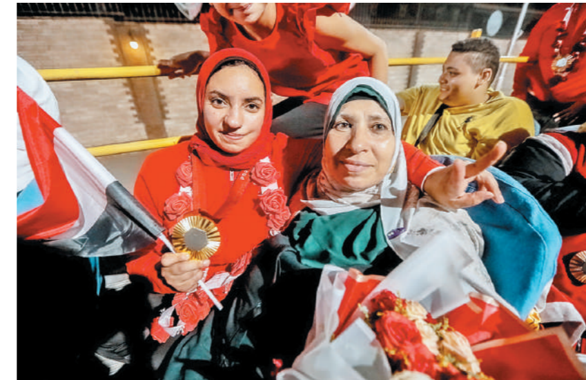
الأهالي في استقبال أبطال مصر البارالمبيين في مطار القاهرة بعد العودة من باريس

تكريم اللاعبين الحاصلين على ميداليات، موجهاً الشكر إلى الجماهير الكبيرة التي حرصت على استقبال اللاعبين في مطار القاهرة. وأشاد وزير الشباب والرياضة بنتائج البعثة المصرية مشيراً إلى الدعم الكبير والمتواصل من القيادة السياسية لكل الأبطال الرياضيين في مختلف الرياضات، مؤكداً أن لاعبي مصر في البارالمبيات نجحوا في رفع اسم مصر عالياً، وتحقيق نتائج مميزة. وأشار صبيحي إلى أن الدولة المصرية تولي اهتماماً خاصاً بالأبطال البارالمبيين، وهناك مساواة بينهم وبين الأبطال الأولمبيين. وموضحاً أن الدولة تهتم بكل ما يخص البطل الرياضي، وحرصها على توفير كل الإمكانيات اللازمة