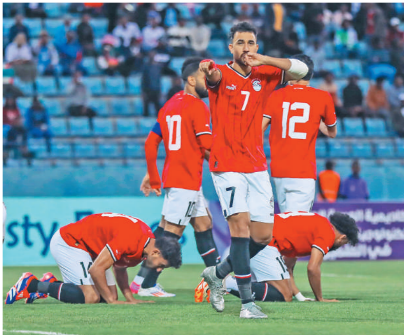
تريزيجه يواصل التألق مع منتخب مصر

وسجل حسام حسن ٦٨ هدفاً في تاريخ مشاركاته مع منتخب مصر ويفصل محمد صلاح ١٢ هدفاً فقط لمعادلة حسام حسن ويصبح الهداف التاريخي للفراعنة. ويأت صلاح للمشاركة رقم ١٥ في تاريخ كرة القدم المصرية الذي يصل للمشاركة رقم ١٠٠ أو أكثر مع منتخب الفراعنة. ويتصدر قائمة اللاعبين الأكثر ظهوراً بقميص منتخب مصر، أحمد حسن قائد الفراعنة السابق برصيد ١٨٤ مباراة دولية.