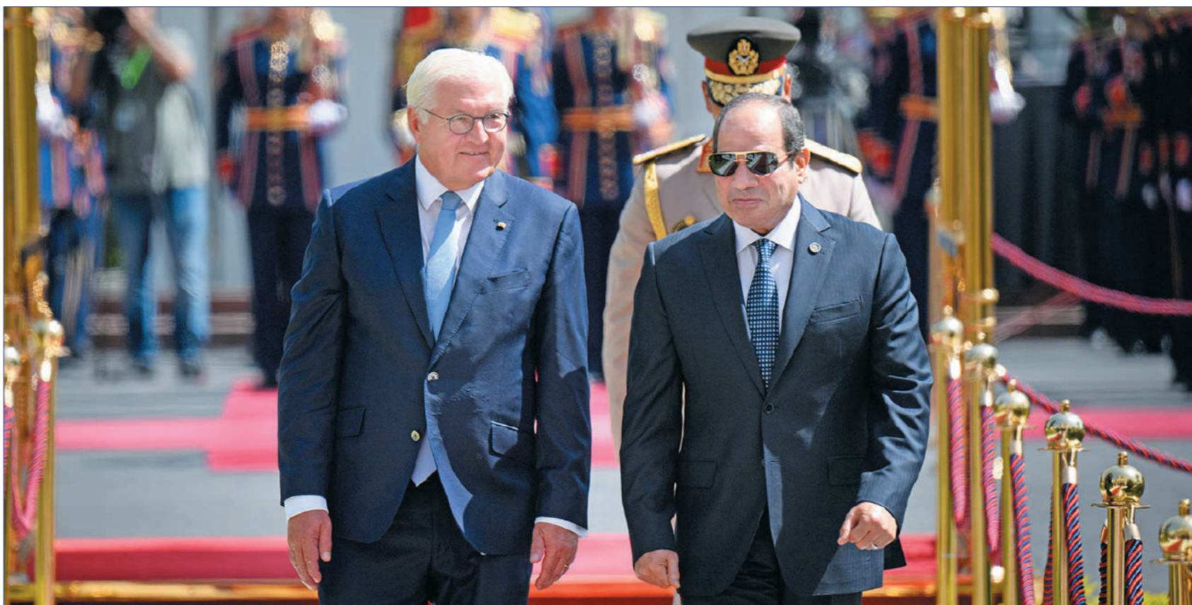
الرئيس السيسي خلال استقباله نظيره الألماني أمس

.. وناقشنا قضية سد النهضة وضرورة الوصول لاتفاق قانوني ملزم بشأن الملء والتشغيل ■ ألمانيا أحد أهم وأكبر الشركاء لنا في مصر وملتزمون بحماية الاستثمارات