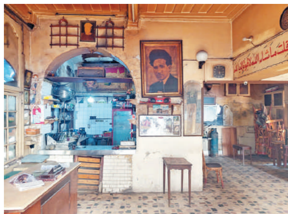
مقاهى كوم الدكة لا تزال تحتل ذكرى فنان الشعب