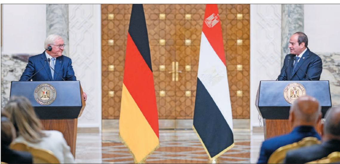
الرئيس السيسى ونظيره الألماني خلال المؤتمر الصحفي أمس

■ الرئيس يحذر من اتساع رقعة الصراع في المنطقة.. وشتاينماير يؤكد أهمية مساهمة المجتمع الدولي في إنهاء الحروب